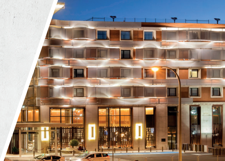
Madrid Marriott Auditorium Hotel and Conference Center

The BIMB Congress will provide next to the very complete conference program also an international trade show for the precast industry, where the visitors will be able to meet 80+ from all over the world companies who are supporting the industry with their services, plant and machinery solutions.