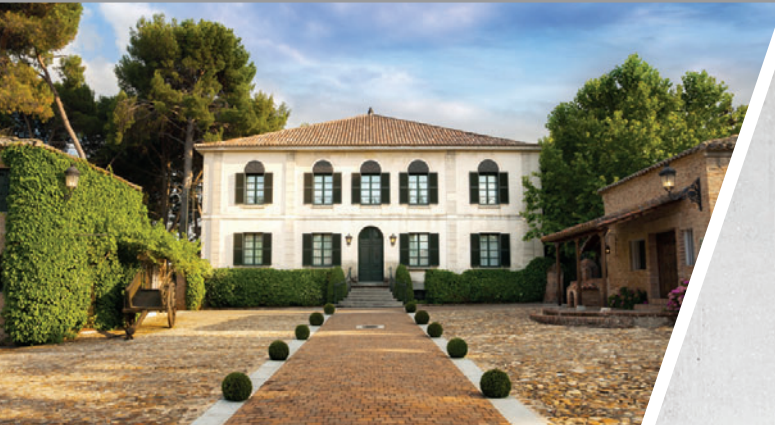
Palacio del Negralejo